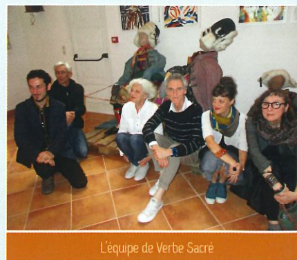
L'équipe de Verbe Sacré