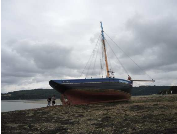
Rade de Brest. Renflouement réussi pour le Dalh Mad

Publié le 12 août 2017 à 07h06 Modifié le 12 août 2017 à 07h16