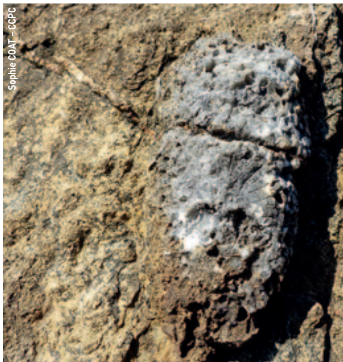
Sophie COAT - CCPC