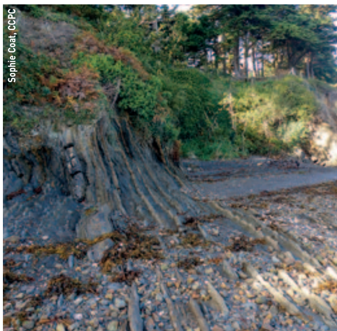
Sophie Coat, CCPC