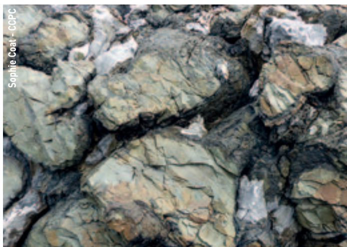
Sophie Coat - CCPC