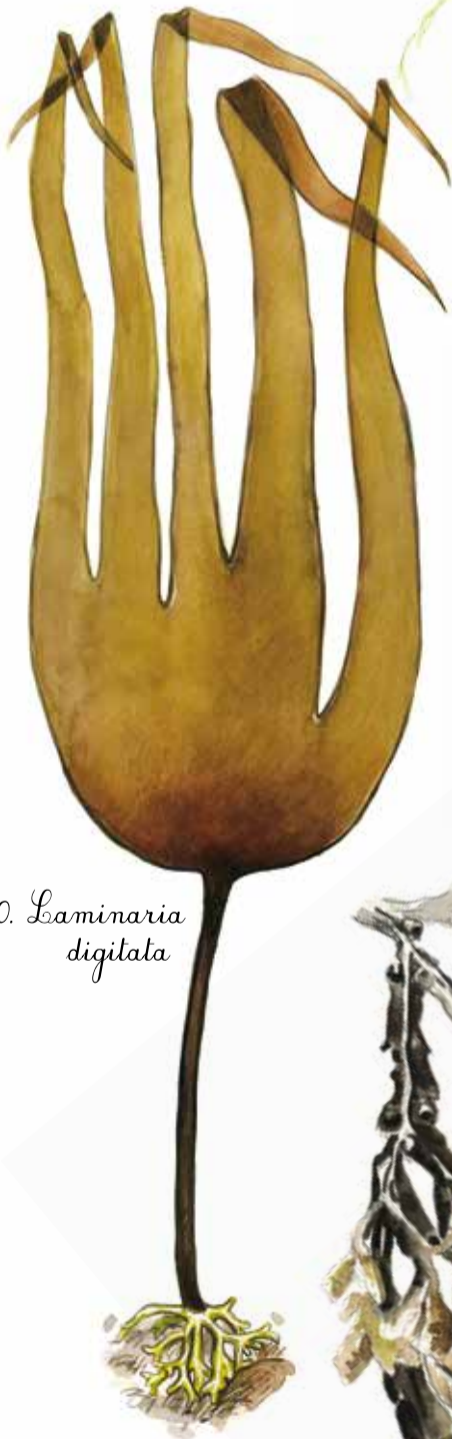
10. Laminaria digitata