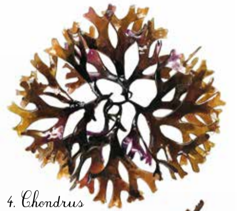
4. Chondrus crispus