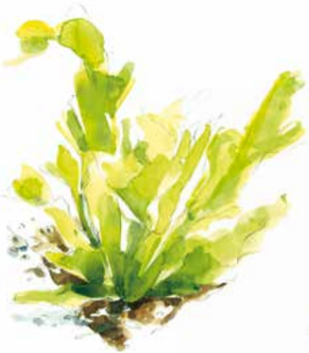
1. Ulva lactuca