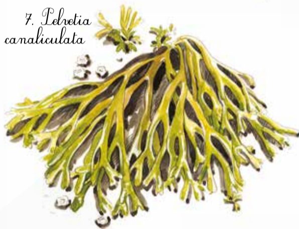
7. Pelvetia canaliculata