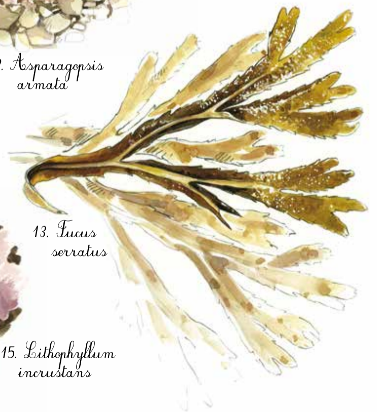
13. Fucus serratus