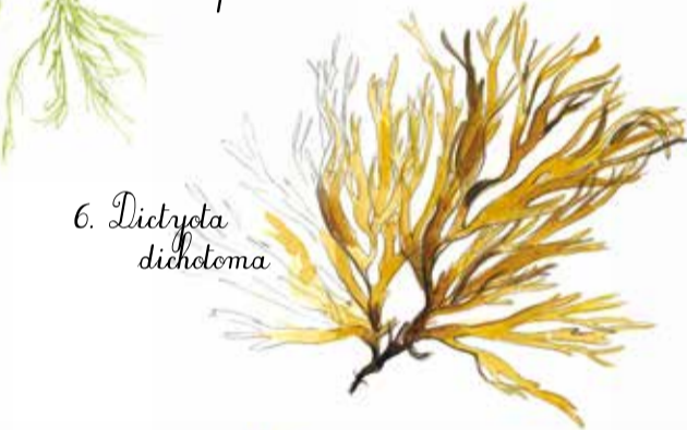
6. Dictyota dichotoma