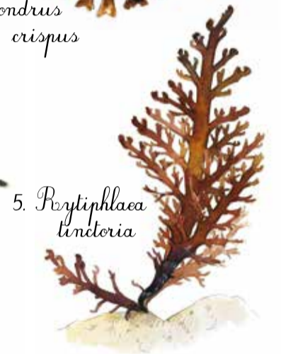
5. Porytiphlea tinctoria