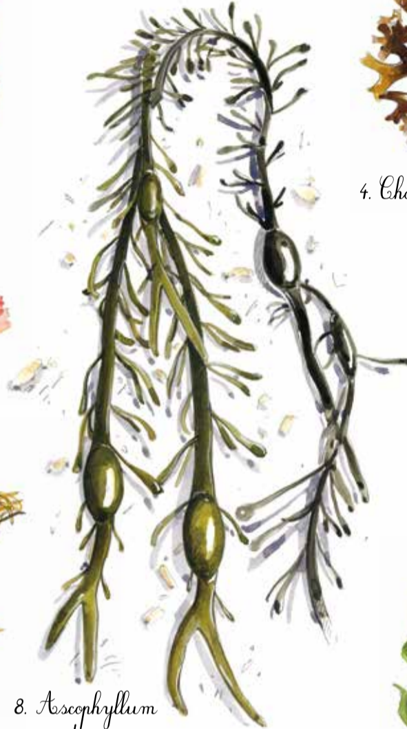
8. Ascophyllum nodosum