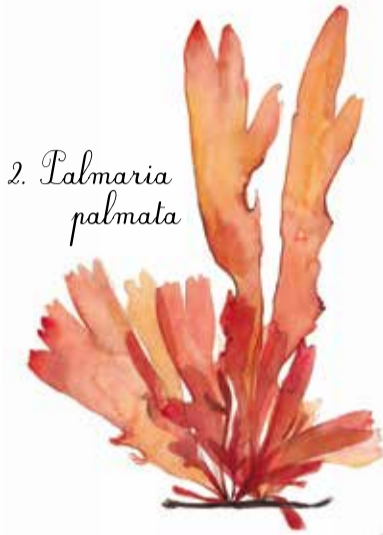
2. Palmaria palmata