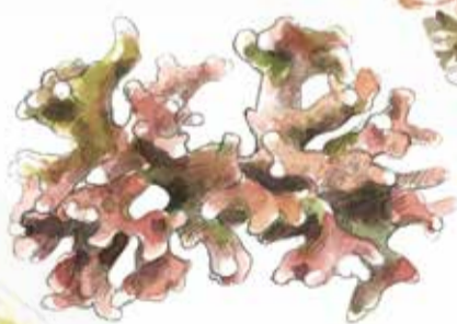
11. Lithothamnion corallioides