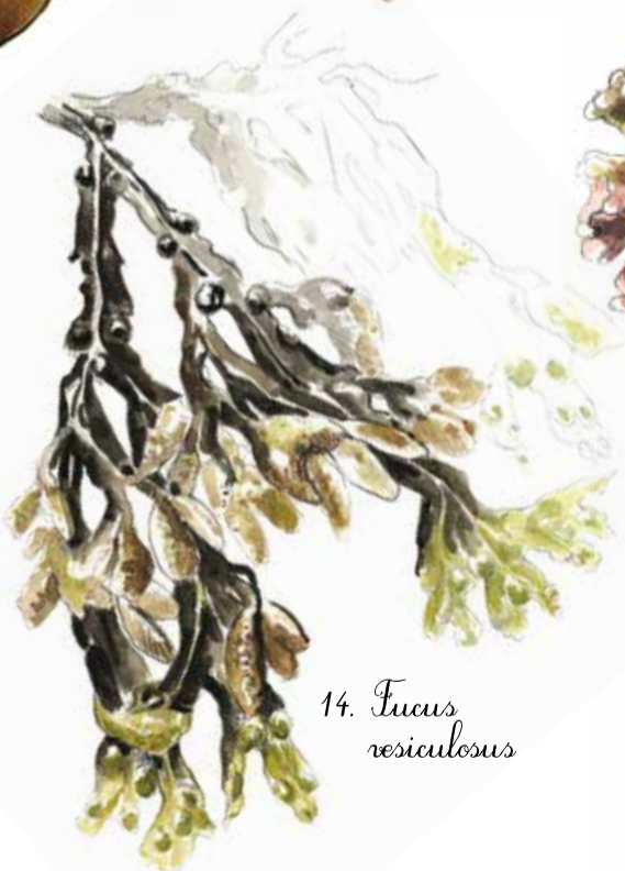
14. Fucus vesiculosus